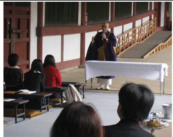
森本公誠・東大寺長老による講話